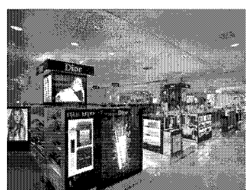
②トラベルセット (イメージ)